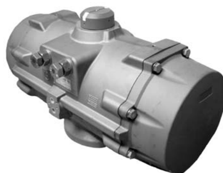
Rys. 2 · Siłownik obrotowy BR 31a firmy Pfeiffer, typ SRP 500