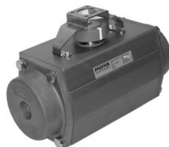
Rys. 1 · Siłownik obrotowy BR 31a firmy Pfeiffer, typ SRP 220