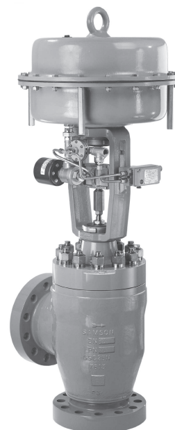
Rys. 2 Zawór regulacyjny typu 3256-1 z siłownikiem pneumatycznym typu 3271