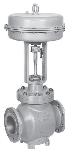
Rys. 1 Zawór regulacyjny typu 3251-1 z siłownikiem pneumatycznym typu 3271