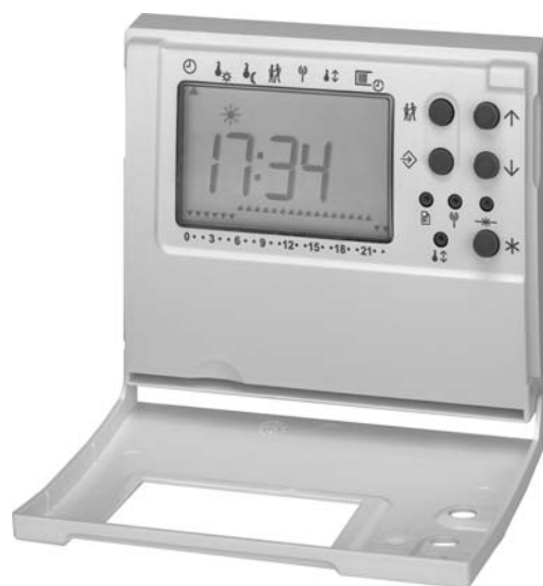
Rys. 1 · Regulator pokojowy TROVIS 5570 z otwartą pokrywą